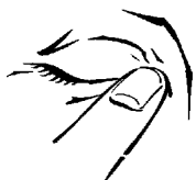
Abbildung 1 Abbildung 2 Abbildung 3 Abbildung 4